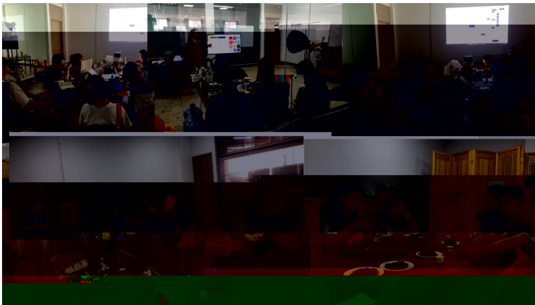
图 特邀企业专家来基地为学生进行专业培训

地 2023 地 ( 2), 供 宝贵的 。 过 的分 , 度 、 场变 , 对电 播 的 。 不 的 储备, 高 操 , 的 发 奠定 础。 措 合 的 度, 地 合 的 。