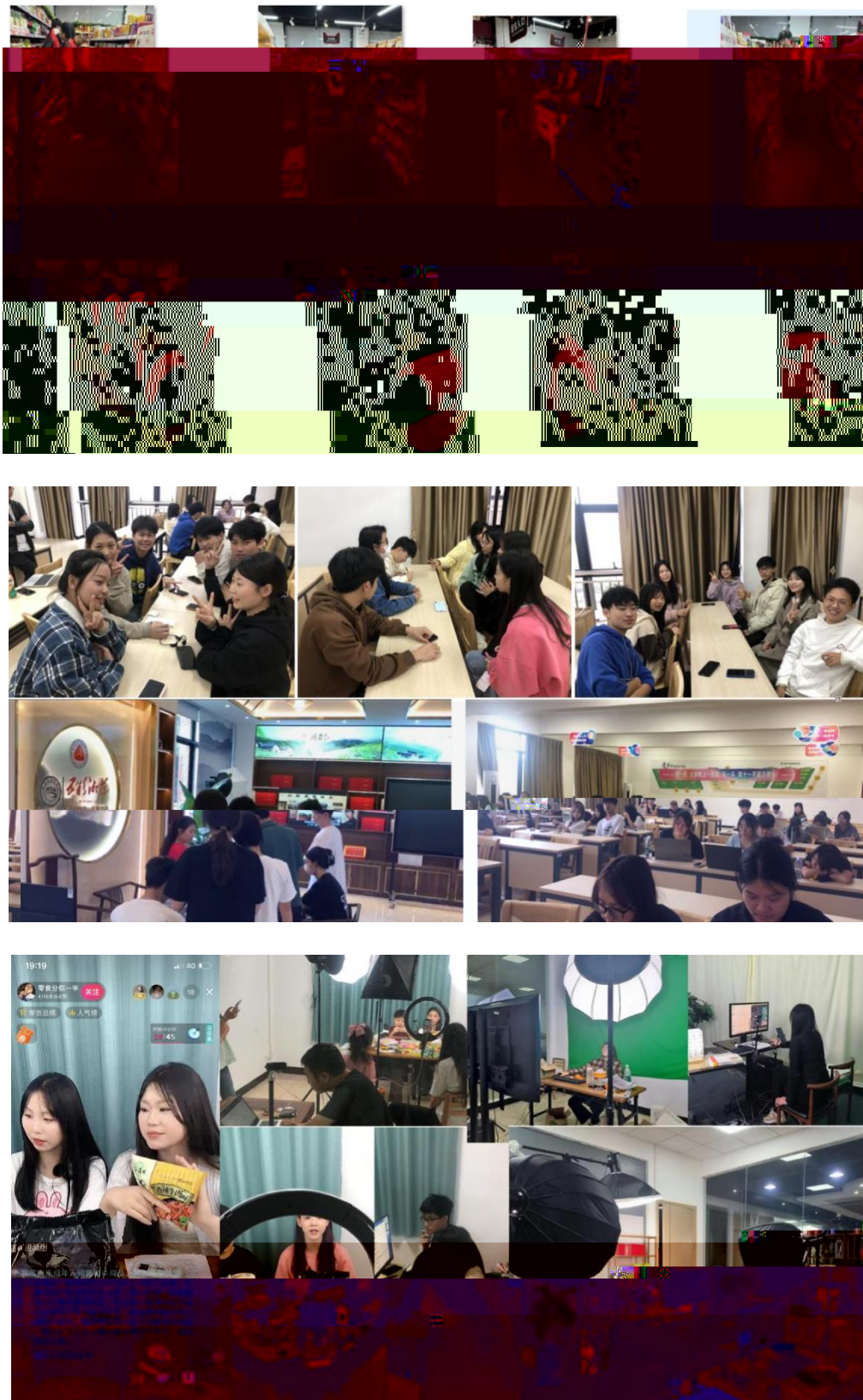
图 组织学生开展实习实训