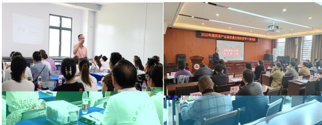
图 企业协助学校为湘西茶企开展电商直播培训

更 对 电 的 。 过 的 ， 茶 得 更 地 电 播的操 、 策 等方 的 ， 电 的 奠定 础。