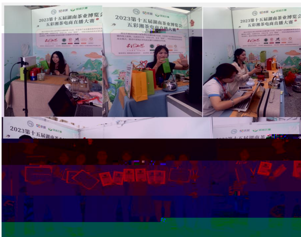
图 “湖南省第十五届茶博会” 电商直播比赛现场

播和方的，短 得的步。 队比 10多单、单， 包但不、等多个，的 和队得的高度。的 得不对公的，更对参 付出和的充分定。