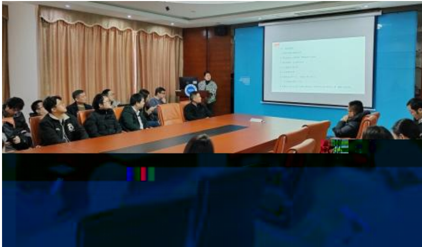
图 员工专业技能培训

2023 年，公司 促 进 发 展 和 才 方 得 成 功。 过 创 造 的 和 平， 不 动 公 司 的 持 续 成 长， 工 供 应 的 发 展 机 会。 过 供 多 样 化 的 和 发 展， “ 队 伍 共 建 ” 等 活 动 ( 4-5)， 帮 工 技 术 和 管 理； 并 的 和 规 划， 工 的 合 作 和 包 导 发 展 计 划、 技 术 及 部 等， 地 促 进 工 的 方 发 展。