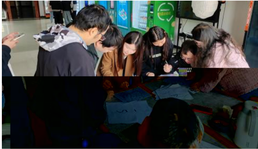
图 卓越团队建设共识营