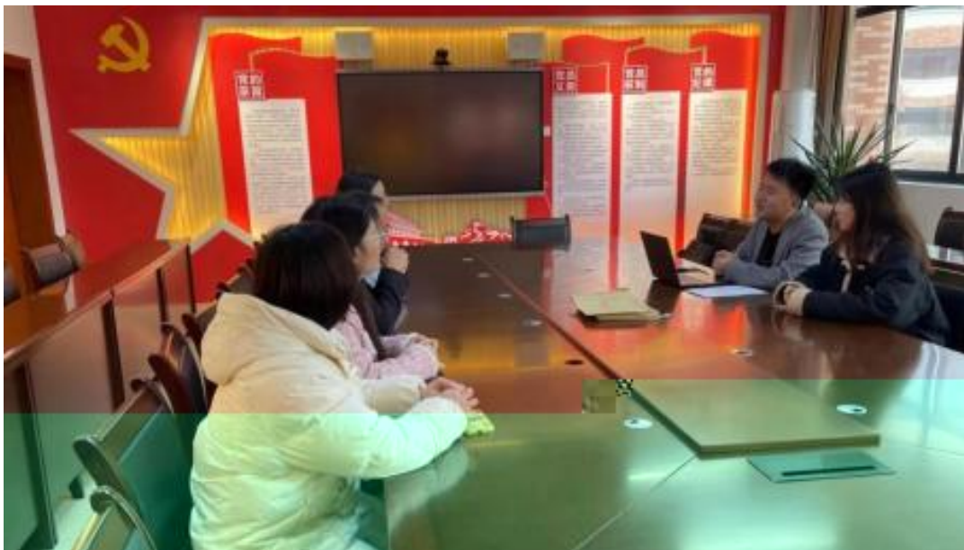
图 校企开展学术研讨项目交流会议

公 高度 队的 ，充分 到 和 的关 ，对 高 和 关 的 。此公 供 ，包 更 、 方法 及 导 发 程，并 持 丰富 的 家 过 、 会和 际案 ， 队 分 的 和 。 常 地 活动， 包 参加 会 、 等 ， 促 的 的 分 ， ， 并 的 队 ( 1)。